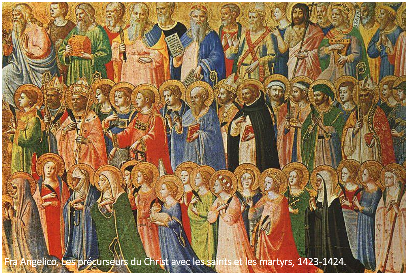
Fra Angelico, Les précurseurs du Christ avec les saints et les martyrs, 1423-1424.

La Toussaint célèbre, comme son nom l'indique, tous les Saints et rappelle à chacun que nous sommes tous appelés à la sainteté.