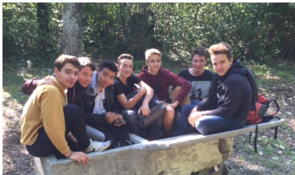
En haut, le groupe d'élèves partis en Irlande, en bas des élèves de Seconde à Cornier.

Plus sérieux, les élèves de Terminale S sont allés à Lyon au Centre d'Histoire de la Résistance et de la Déportation. A travers l'exposition permanente et celle sur le procès Barbie de 1987, ils se sont replongés dans leur programme d'Histoire sur la Seconde Guerre et ont découvert la pertinence, la ri-