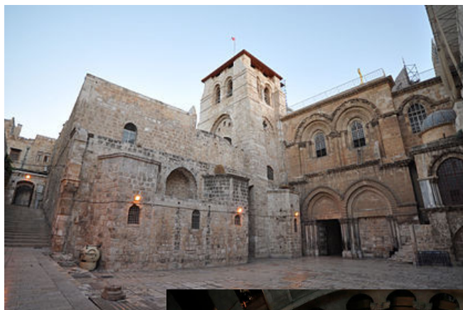
La basilique du Saint Sépulcre..

1099: Les Croisés s'emparent de Jérusalem et le sépulcre redevient un lieu de pèlerinage.