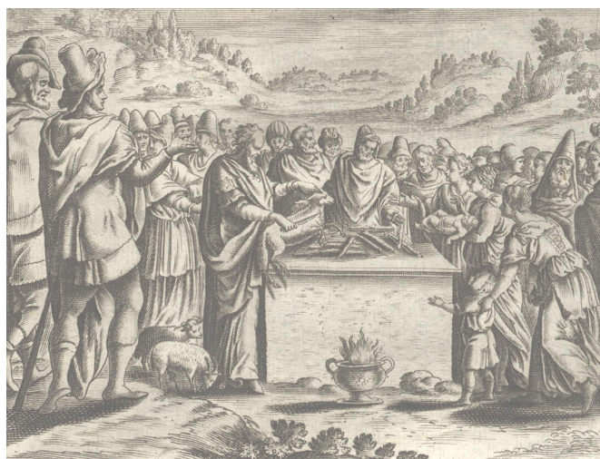
Illustration de l'offrande pascalle (Jollain, 1670)